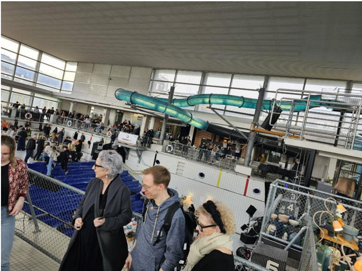
Im Vordergrund: Interessierte Beobachter/innen in allen Altersgruppen – ganz hinten unter der Wasserrutsche ein ganze Zeile von originellen Verpflegungsständen und Bars.