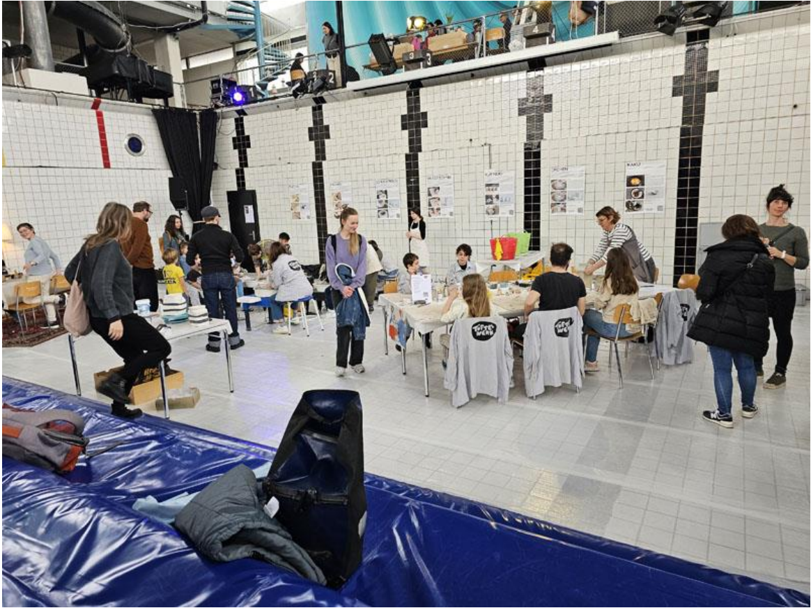
Highlights am tiefsten Punkt des Pools (unter dem Sprungturm 😊): Workshops fürs Publikum (Tisch rechts meist jüngere Künstler/innen am freien Modellieren unter sachkundiger Anleitung – Tisch links hinten die Grösseren, die sich bereits mit der Töpferscheibe herumschlagen.